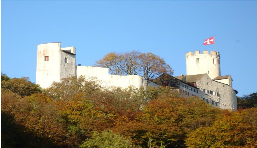
Schloss Neu Bechburg