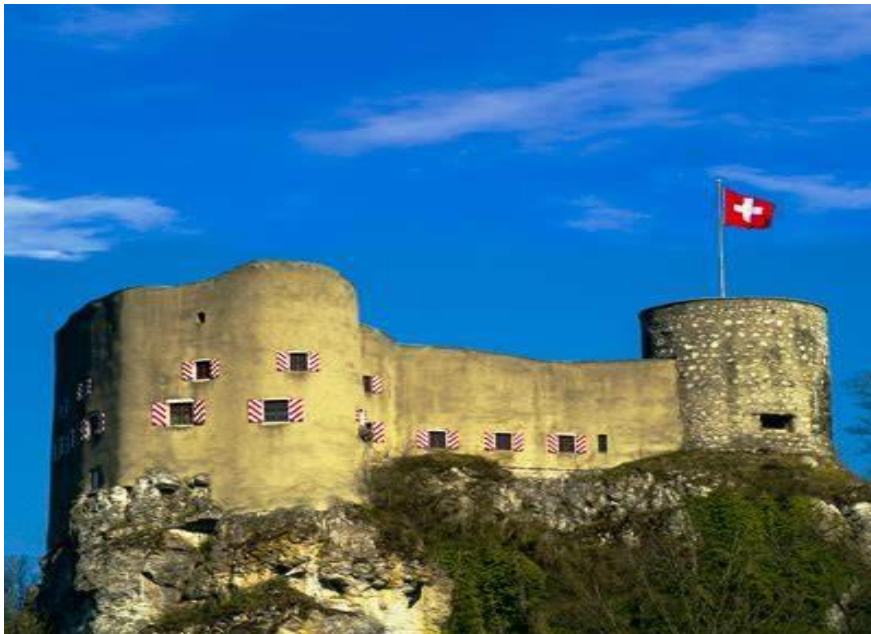
Burg Alt Falkenstein