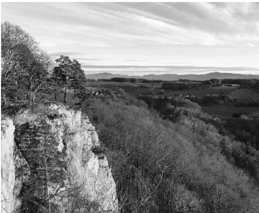
Aussicht Gempenfluh

Auch um den Gempen war ich unterwegs und mehrmals war mein Endziel die Schartenfluh oder auch Gempenstollen oder Gempenfluh genannt. Eine herrliche Rundschau ist oben auf dem Turm zu erleben. Auch die Region um Büren und Nuglar mit den vielen Kirschbäumen soll nicht unerwähnt bleiben. In dieser Region hat es jeweils zur Kirschenblütezeit sehr viel Wandervolk. Die Wanderwegsignalisation ist in der Umgebung um Büren / Nuglar in die Jahre gekommen und muss in nächster Zeit auf den aktuellen Stand gebracht werden.