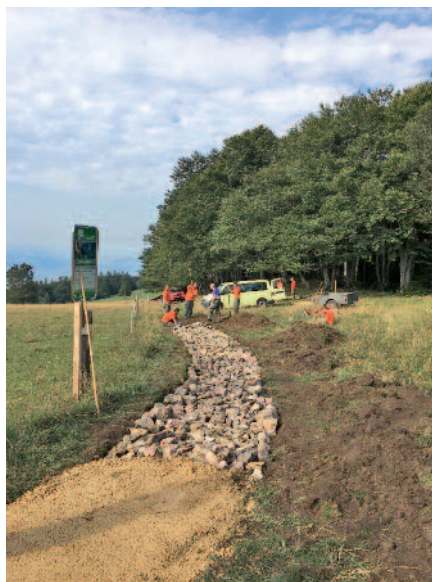
Weissenstein RZSO Solothurn, Pro Weissenstein, SOWW