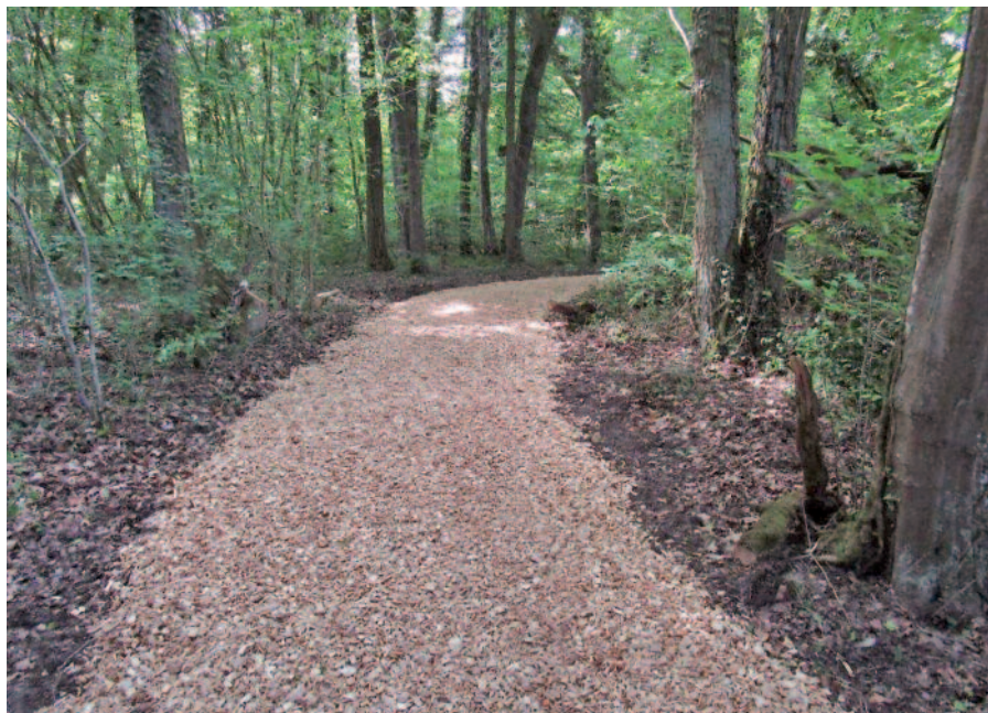
Wöschnau-Aarau Stadt Aarau, ZSO Aarau, Forstbetrieb Niederamt, SOWW