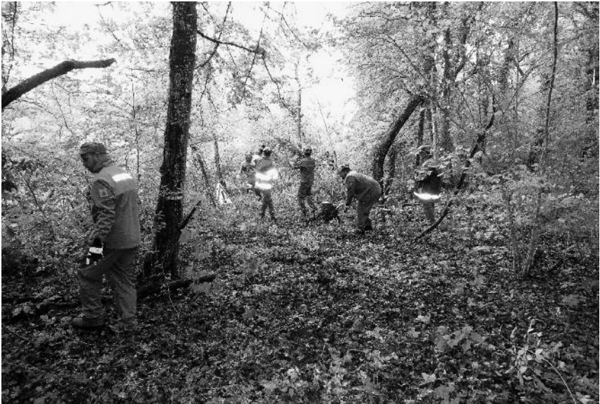
Vom 2-6. 09.2019 wurde dann der Wanderweg in Winznau durch den ZS Niederamt, an der Aare entlang neu erstellt. (siehe Foto) Danke. Beim Bhf. Olten haben wir die Umleitung am 15.07.2019 wieder demontiert.