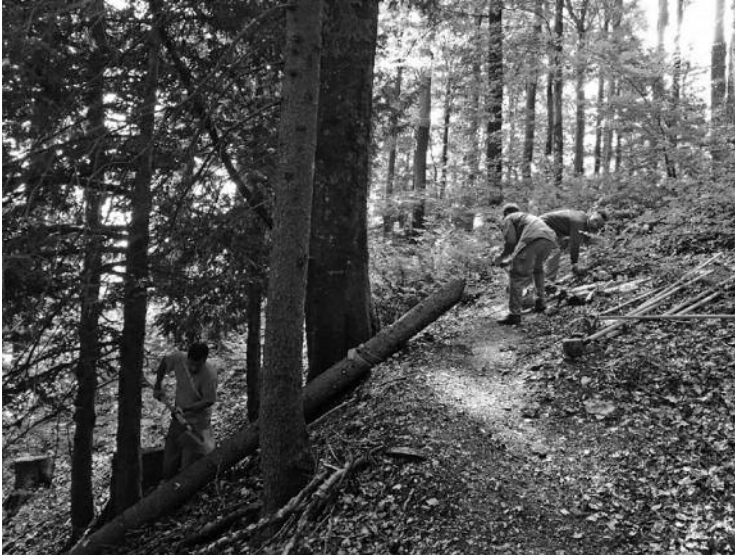
Balm b. Günsberg / RZSO Solothurn, SOWW